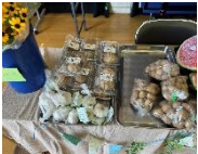
白・黒ニク/じゃが