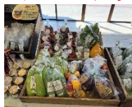
ピーマン/なすび等