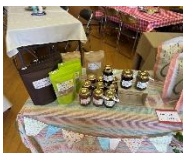
ブルーベリージャム/ごぼう茶等