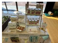
マヨネーズ/平飼いたまご