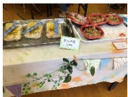
チラン寿司/から揚げ