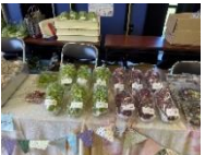
シャインマスカット等